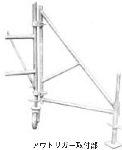
アウトリガー取付部