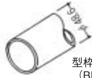
型枠用 (ピンなし) (BP)